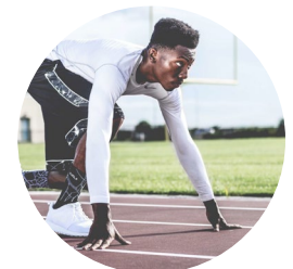
u.a. BEI EXTREMER BELASTUNG